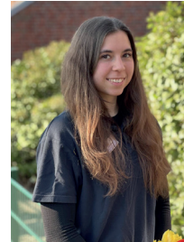
Jessica Mahkota Kontrollkommission