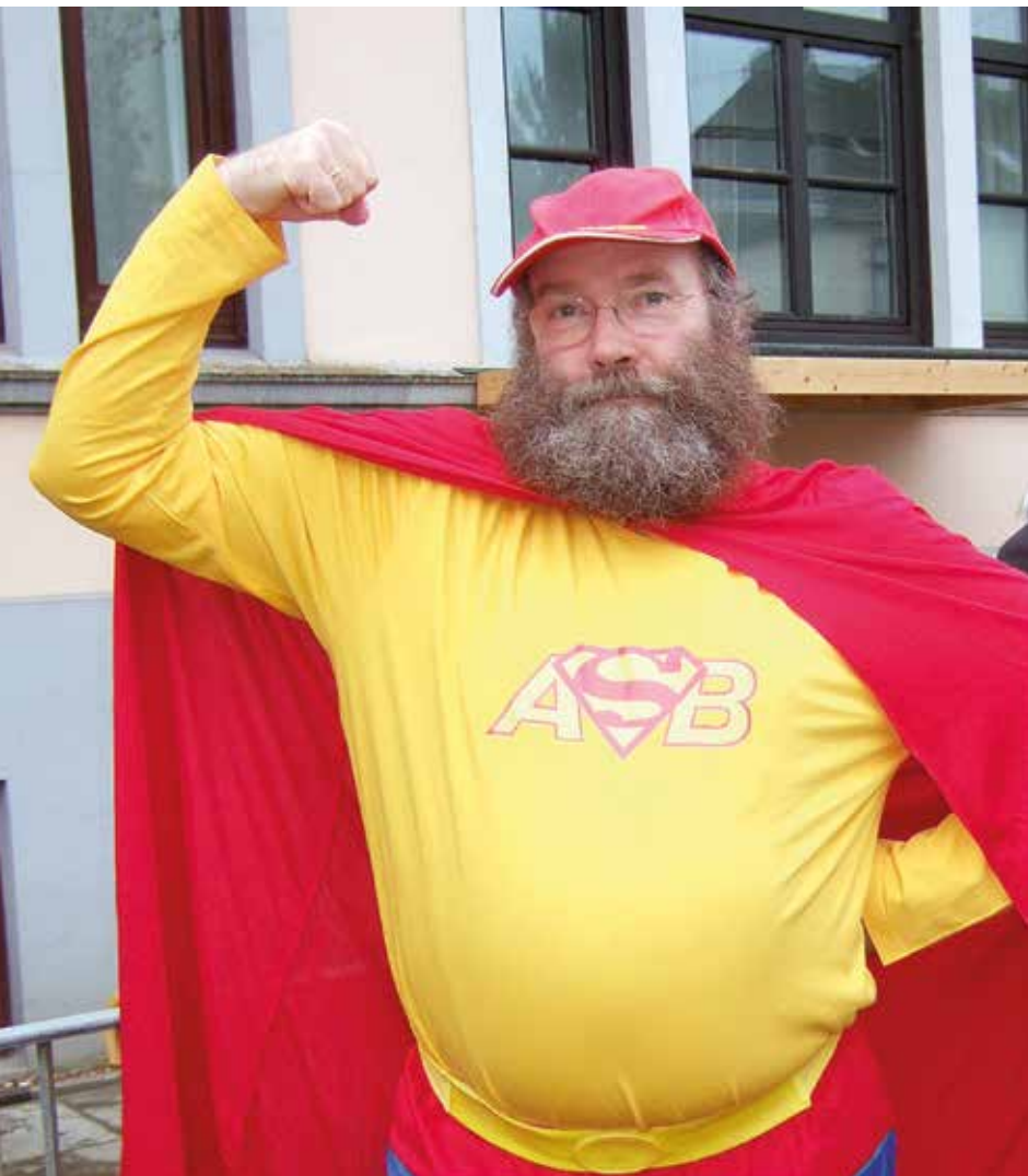
Der Chef beim Freimarktsumzug 2017 im Superheldendress.

tungskräfte geschult. Um fair mit dem ASB umzugehen, reduzierte ich meine Geschäftsführer-Zeit auf 30 Wochenstunden und habe das nie bereut. Ich wurde über meinen Diplomvater beim Aufbau des Internationalen Studienganges für Pflegewissenschaft (ISPG) in Bremen mit involviert und war dort als freier Dozent fünfzehn Jahre aktiv. Ich habe Diplom- und Bachelorarbeiten als Zweitleser betreut und Kolloquien mit abgenommen. Viele Jahre lang waren Studierende bei uns in der Pflege für ihre Projekte oder für Praxiserfahrungen eingebunden. Daher sind alle aktuellen Pflegedienstleitungen und die beiden