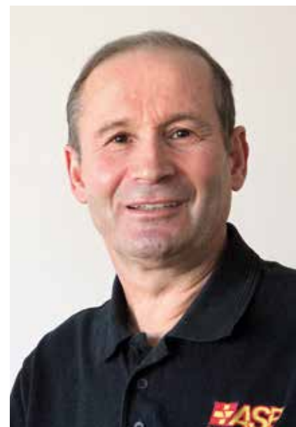
Bahadır Elmalipinar wird von Kolleg*innen und Kund*innen nur „Timo“ genannt.