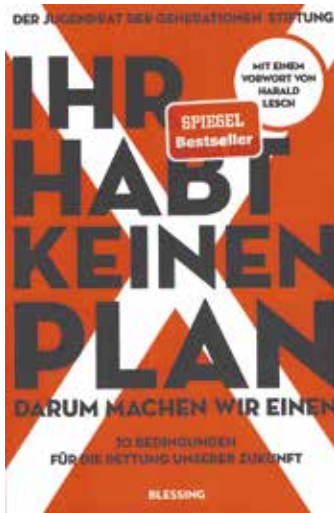
Der Jugendrat der Generation Stiftung „Ihr habt keinen Plan“ ISBN 978-3-89667-656-6

„Der Jugendrat der Generation Stiftung ist eine Plattform, die motivierten Jugendlichen, jungen Erwachsenen und Aktivist*innen den Raum und die Werkzeuge gibt, um politisch und zivilgesellschaftliche Verantwortung zu übernehmen. Der Jugendrat setzt sich dafür ein, dass Generationengerechtigkeit zum Maßstab von politischen Entscheidungen wird.“ (Klappentext) Acht junge Menschen zwischen dem 19. und 26. Lebensjahr haben dieses beeindruckende Werk zusammengestellt. Sie haben dabei die Expertise vieler Menschen gesucht und gefunden. Das Ergebnis ist ein beeindruckend vielfältiges Werk, in dem die „10 Bedingungen für die Rettung unserer Zukunft“ in insgesamt 100 Forderungen zur Zukunftsrettung münden. Ich erlebe nun im Alter von 63 Jahren, dass wir älteren Erwachsenen den nächsten Generationen viele Baustellen und eine bedrohliche Hinterlassenschaft „schenken“. Wir Menschen aus der Nachkriegsgeneration haben den Wohlstand umfassend erfahren, durften uns frei entwickeln und sind nun erbarmungslos in der Nutzung der Natur und der Ressourcen der Erde. „Nach uns die Sintflut“ ist das Kredo. Gier, Machthunger, Geiz und eine beängstigende Ich-Bezogenheit prägt unsere Generation. Keine*r will auch nur einen Deut Verzicht üben. Das Erworbene, Errungene wird rücksichtslos festgehalten. Wir benutzen die Natur für unsere kurzzeitige Befriedigung,