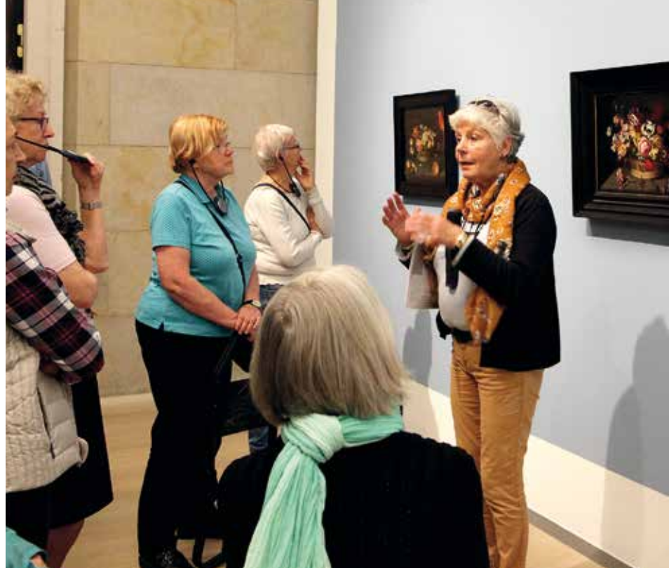
Detailgetreue Stilleben: Blumen, gemalt von Ambrosius Bosschaert der Jüngere.