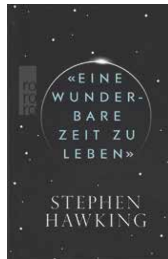
Stephen Hawking – „Eine wunderbare Zeit zu leben“ ISBN 978-3-499-63235-8