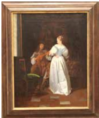
Jacob Ochtervelts Darstellung einer Dame in einem weißen Seidenkleid, dem Betrachter mit dem Rücken zugewandt, gehört zu den künstlerisch herausragenden Bildern der Sammlung niederländischer Altmeister in der Kunsthalle.

Führung durch die Ausstellung „Tulpen, Tabak, Heringsfang“ in der Kunsthalle mit Gemälden niederländischer Altmeister