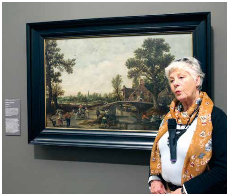
Jan van Goyens Gemälde „Dorflandschaft“ von 1625 befindet sich bereits seit längerem im Besitz der Kunsthalle.