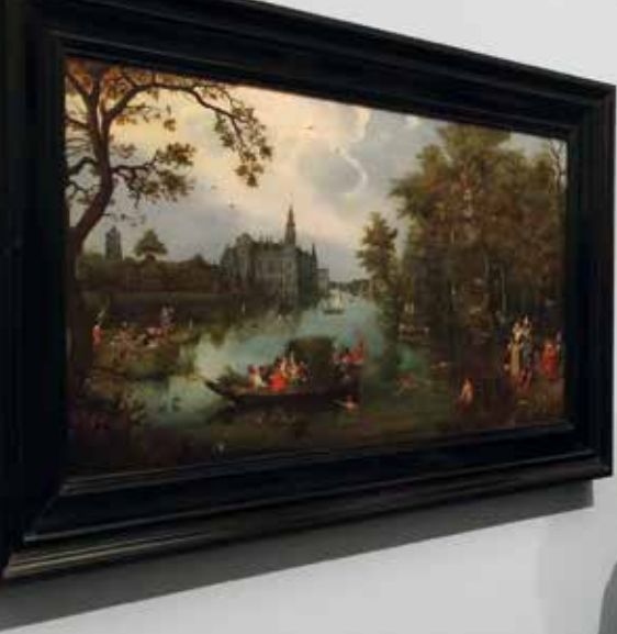
„Badende Nackedeis“, dargestellt in einem Gemälde, seien für die damalige Zeit etwas Unglaubliches gewesen, verwies Bea Rademacher-Aarnoutse auf Adriaen Pietersz. van de Venne's Bild.